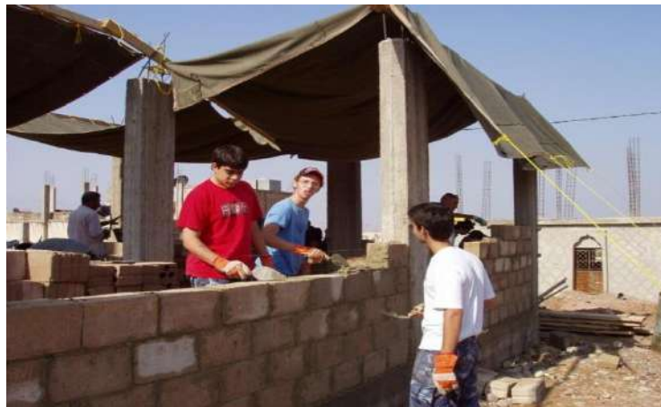
خدمة تطوعية - بناء منزل صغير لسيدة مسنة