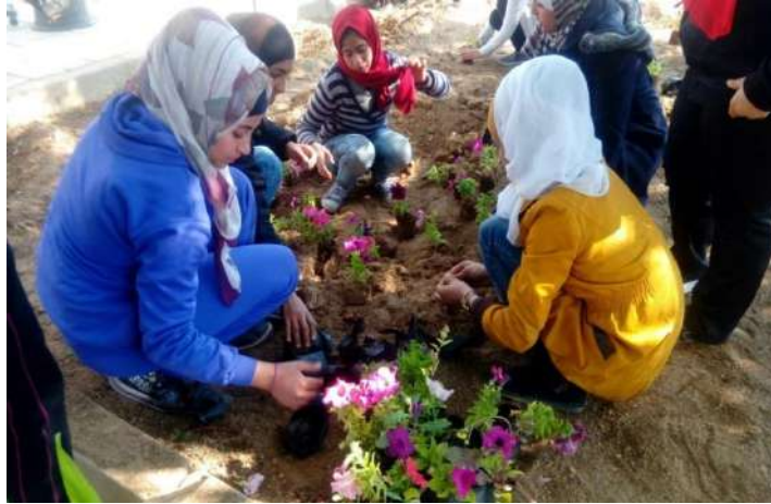
برنامج السوسنة البيئي - زراعة الاشجار