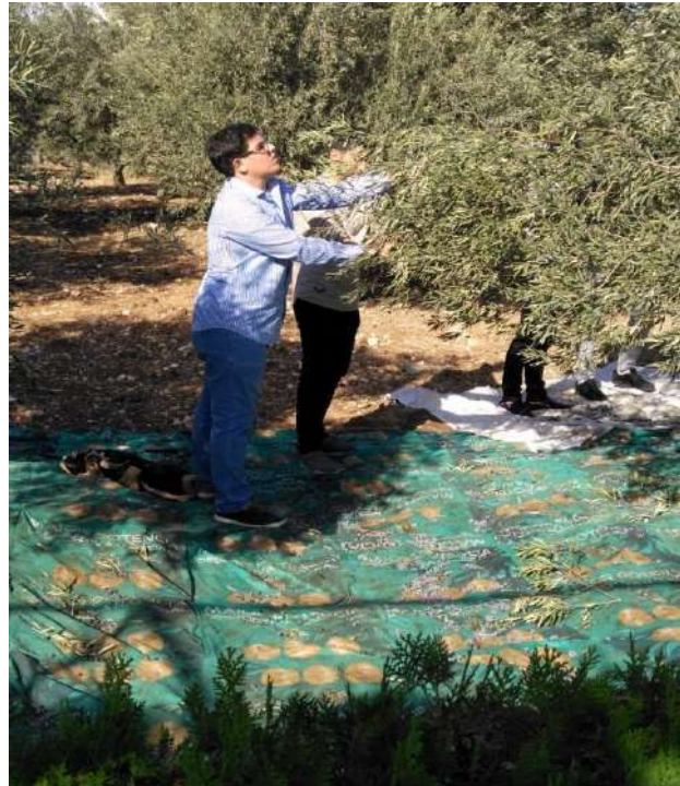
خدمة تطوعية – قطف زيتون