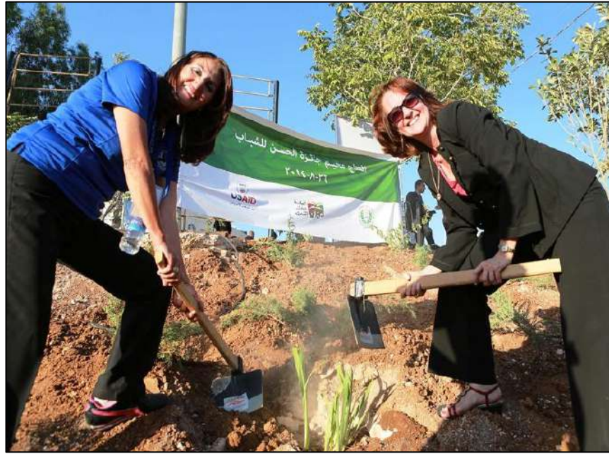
برنامج السوسنة البيئي - زراعة الأشجار

"تخيل المجتمع و العالم عندما يتوفر به العديد من الاشخاص الذين يمتلكون هذه الصفات"